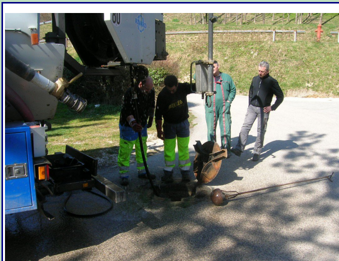
1 h 1/2 d'intervention...

Et voilà le résultat quand ces lingettes arrivent à la station !!!!!