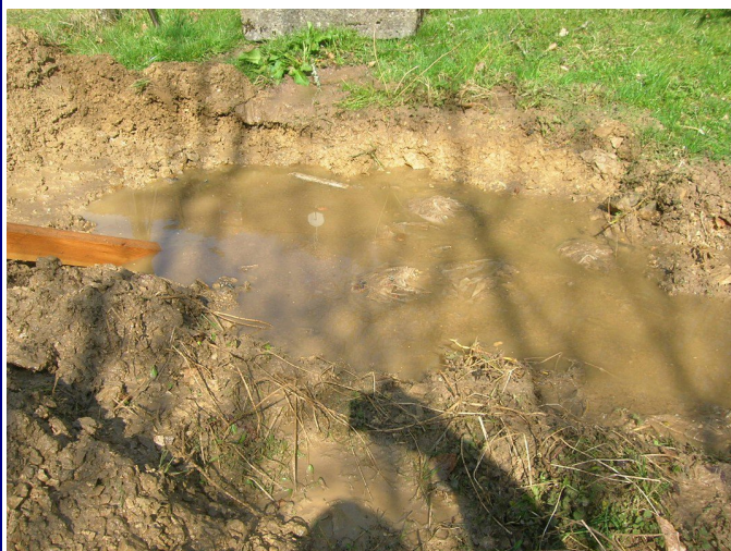
Image peu ragoutante mais triste réalité

Pour votre information, nous vous rappelons qu'il est fortement déconseillé de mettre n'importe quoi dans les toilettes. En l'occurrence des lingettes.